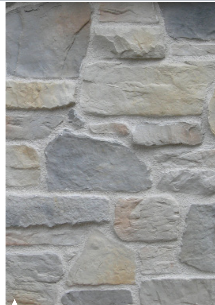
CENERE / ASH CENERE / ASH