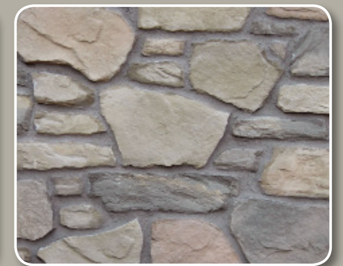
MARRONE TERRA / BROWN EARTH