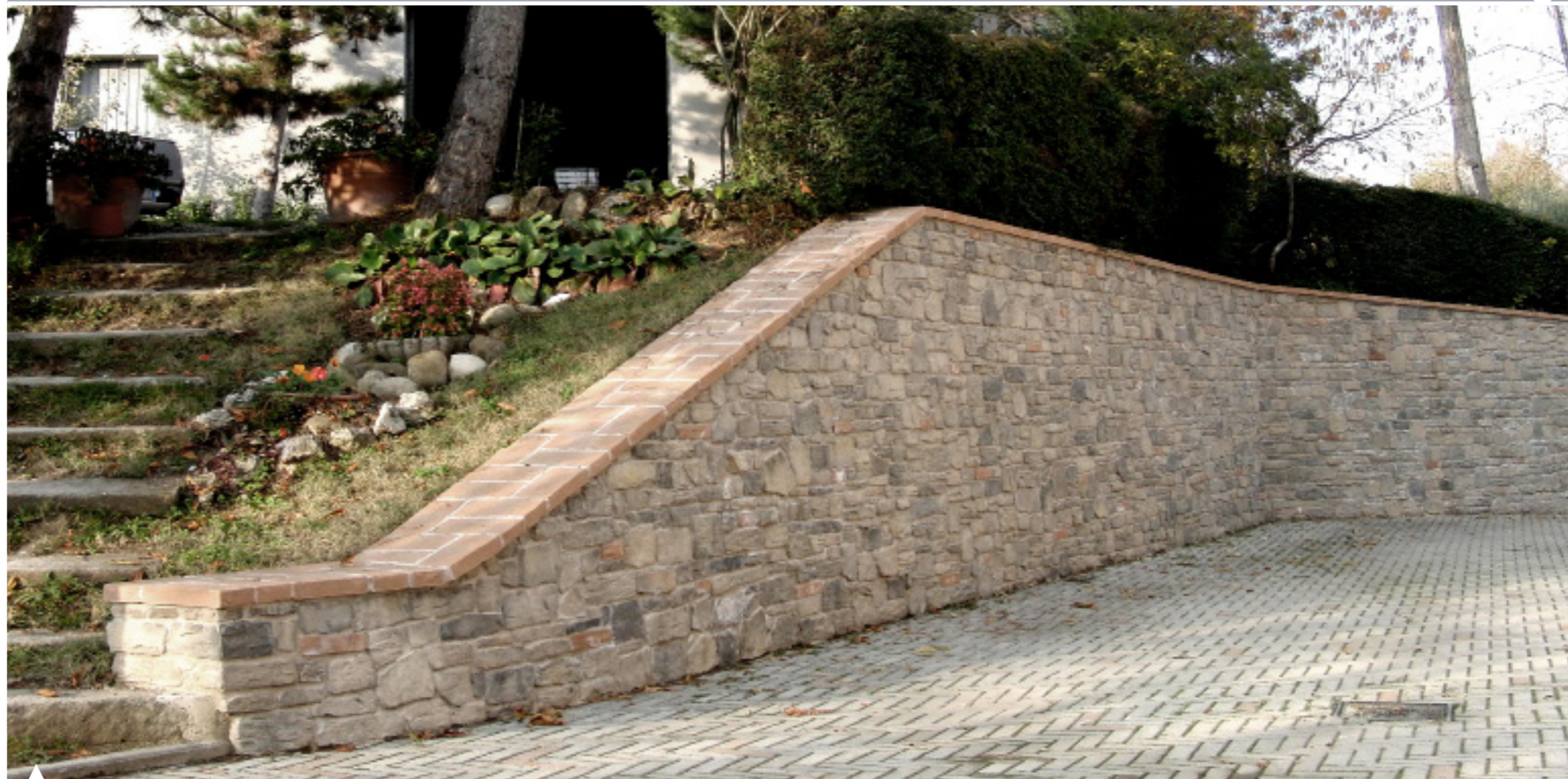
MARRONE TERRA / BROWN EARTH