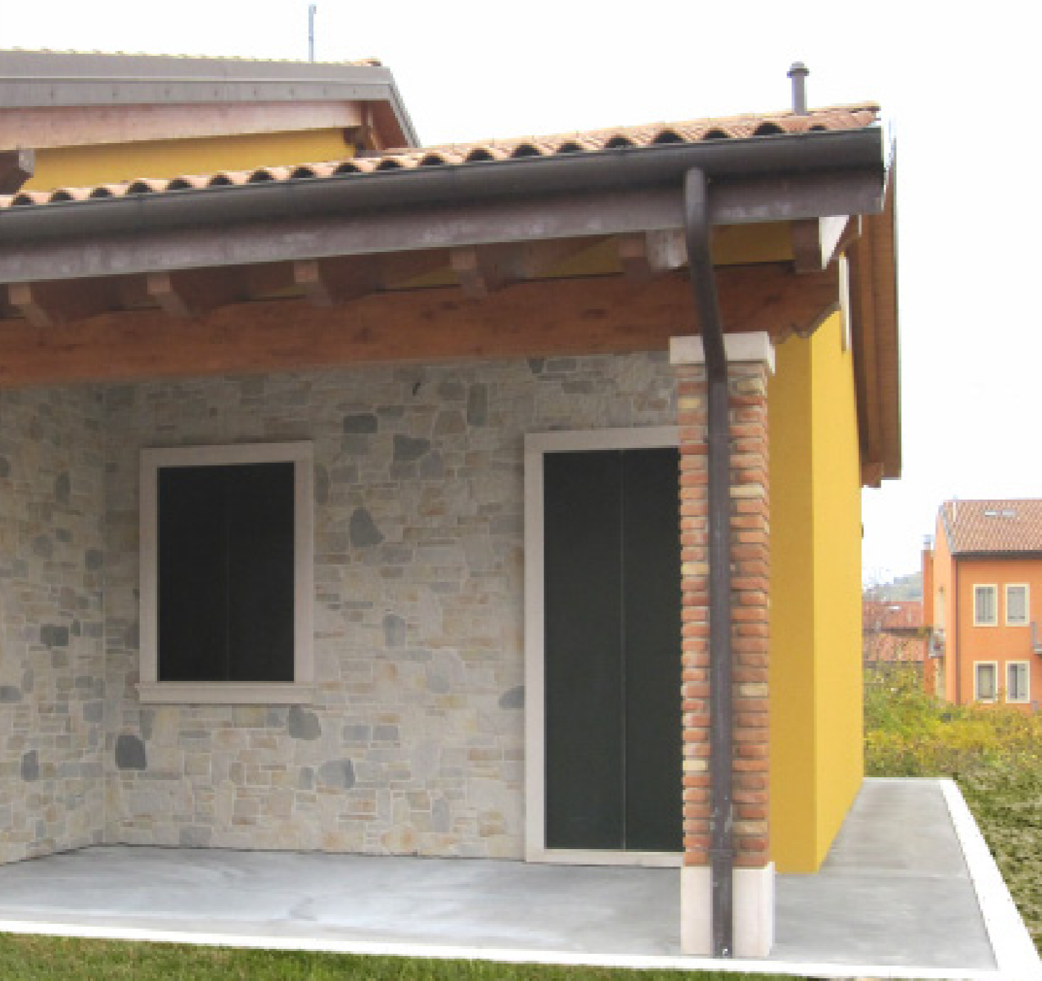
CENERE / ASH