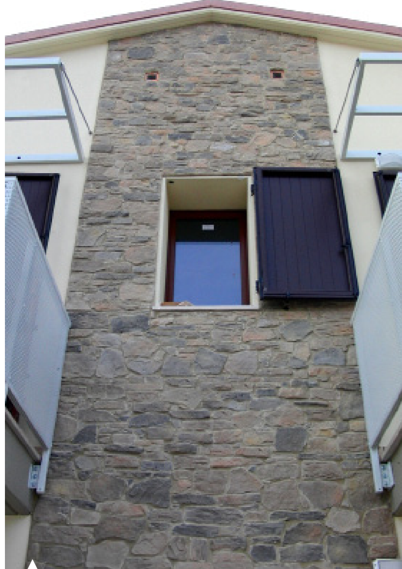
MARRONE TERRA / BROWN EARTH MARRONE TERRA / BROWN EARTH