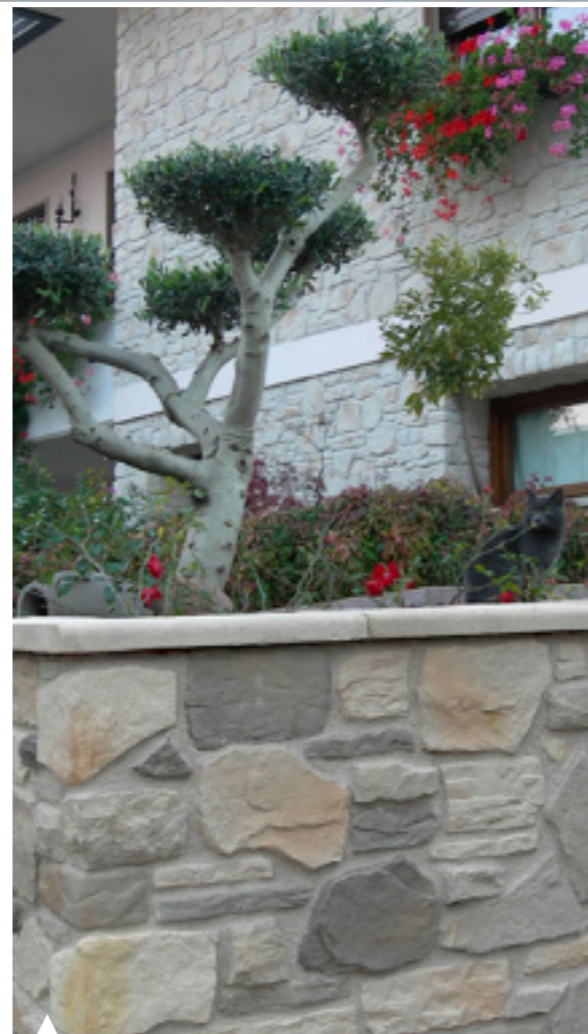
CENERE / ASH